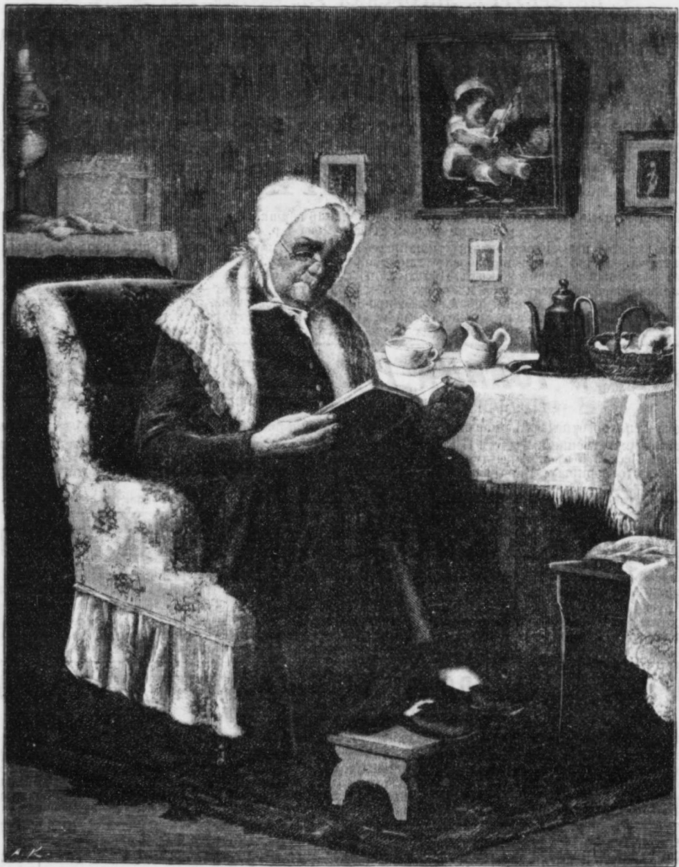
За утреннимъ кофе. Съ карт. акад. гессина. «Родина», 1895 г. № 8.

Безъ всякой платы за пересылку и доставку премій и приложеній.